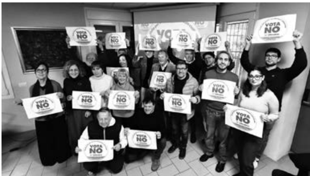
Parma, Comitato società civile per il No nel referendum costituzionale