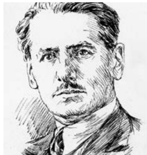
Guido Picelli, organizzatore degli Arditi del Popolo nel 1922 e morto in Spagna partecipando alla Guerra civile spagnola.

... gli uomini che a Parma hanno operato e creato un 'reale' cambiamento