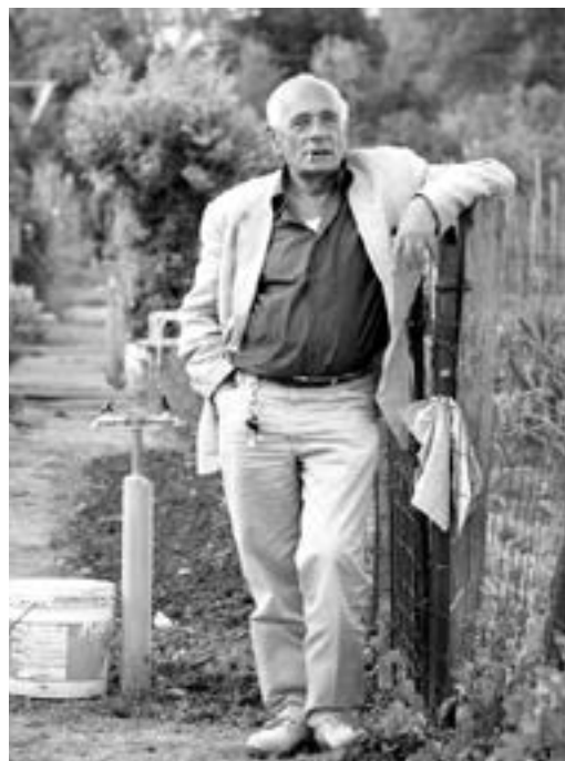
Mario Tommasini, negli orti sociali, insieme a Franco Basaglia, chiuse l'ospedale psichiatrico di Colorno.