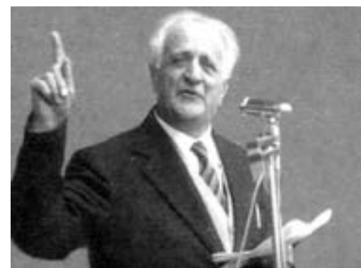
Giacomo Ferrari, partigiano 'Arta', ministro dei trasporti dal 1946-'47, e Sindaco di Parma dal 1951 al 1963.